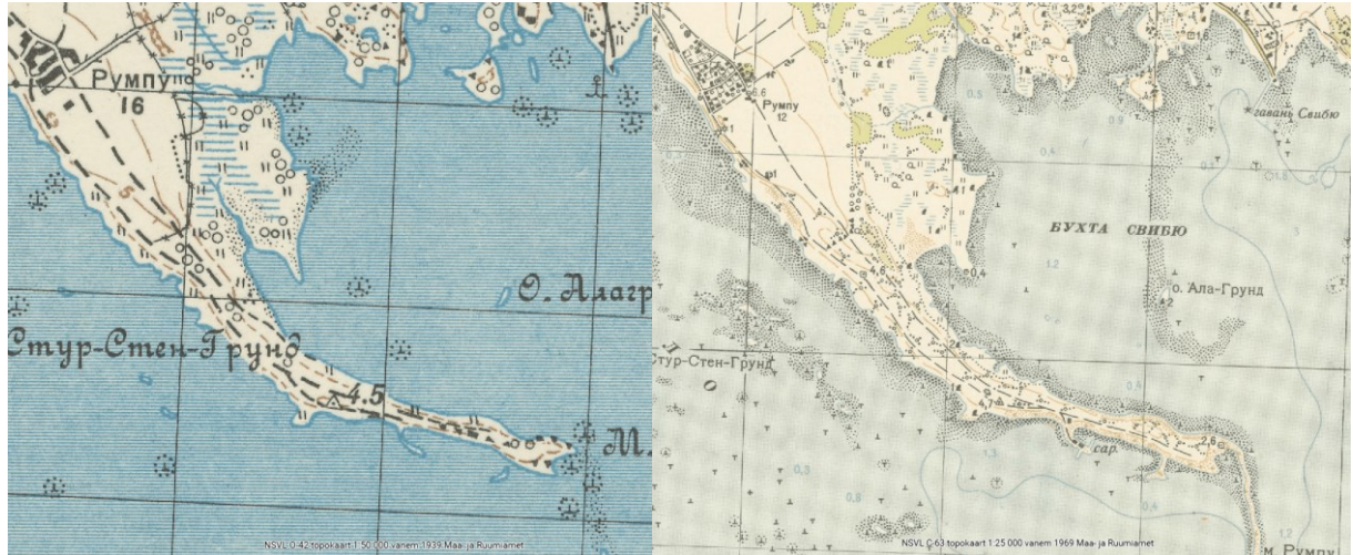
Joonis 1. Ajaloolised teed Rumpo poolsaarel (väljavõte Maa- ja Ruumiameti ajalooliste kaartide kaardirakenduse 1939. ja 1969. a kaartidest)

Rumpo matkarada on osa Vormsi maastikukaitseala külastustaristust, mis on rajatud eesmärgiga tutvustada avalikkusele kaitseala kaitsekorda, eesmärke ja väärtusi ning suunata külastajad selliselt, et nad kaitse-eesmärgiks olevaid väärtusi ei kahjusta. Rumpo matkarada kulgeb kogu ulatuses olemasolevatel teedel, sh Paali kinnistut läbival ajaloolisel teel (vt joonis 1).